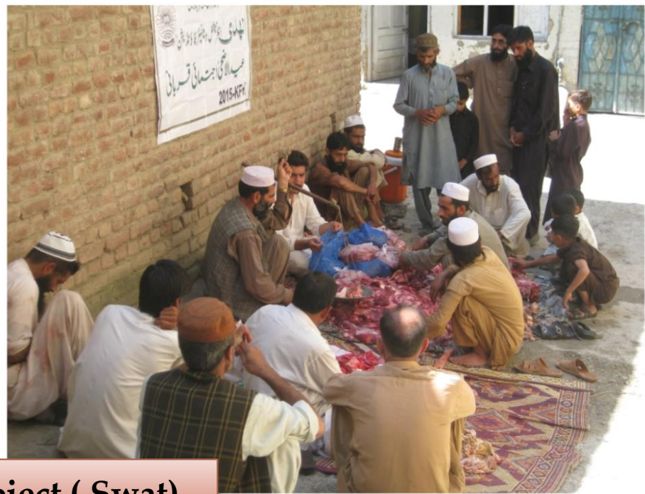
Qurbani Project ( Swat )