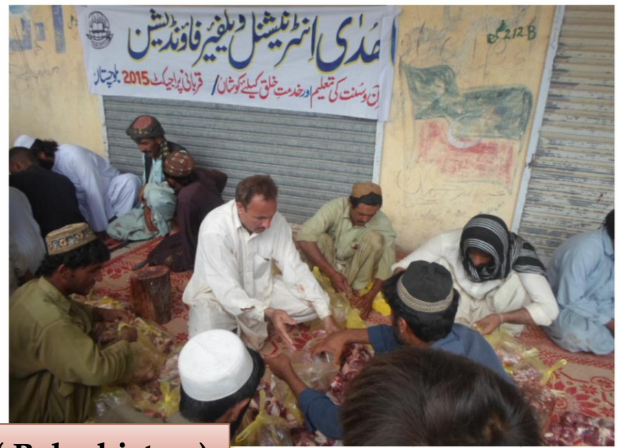
Qurbani Project ( Baluchistan )