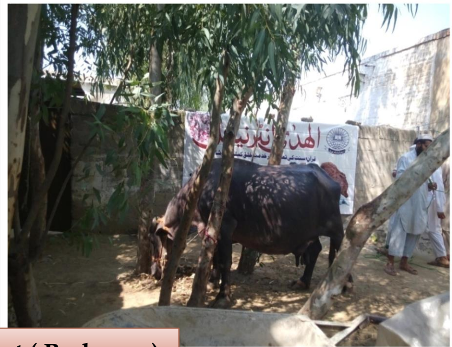
Qurbani Project ( Peshawar)